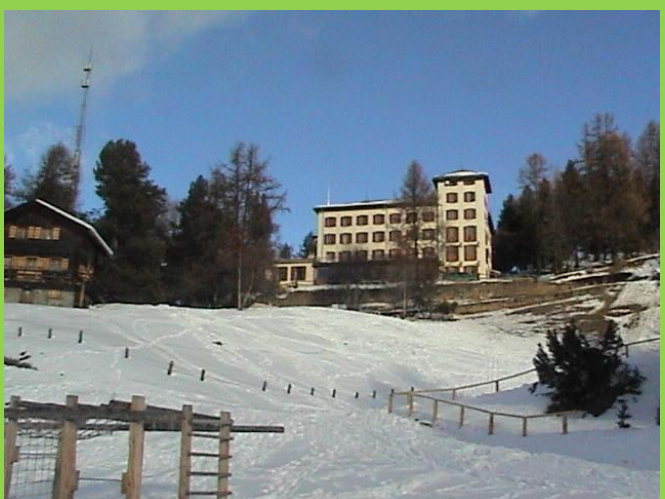
Das Hotel, gesehen aus Richtung der Kirche