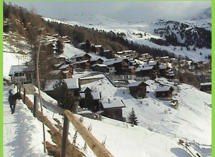
Restaurant im alten Dorf