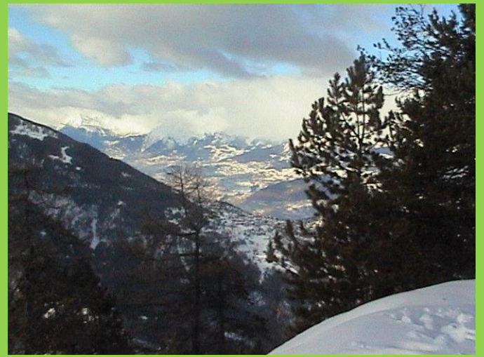
Matterhorn, Dent Blanche