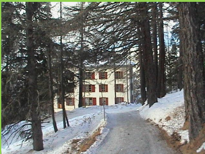
Lerchenallee zum Hotel